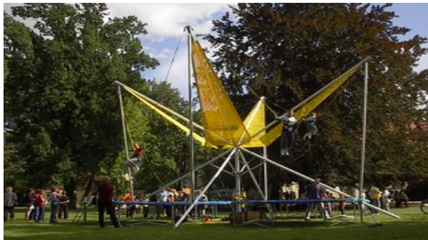
Platzbedarf: 10 x 10 m, Strom: 220 V / 16 A

Unsere Bungee- Trampolin- Anlage ist völlig sicher und mit der Auszeichnung „ TÜV-geprüfte Sicherheit GS “ versehen. Je zwei Gummiseile fangen die Springer immer wieder sanft auf und sorgen so für ein kontrolliertes Aufkommen im Zentrum des Trampolins. Einfach und völlig sicher erreichen auch Ungeübte eine Sprunghöhe von ca. 9 m. Der Springer kann durch Armkraft und zusätzlichen Schwung holen die Sprunghöhe selbst bestimmen und seinen Möglichkeiten bzw. seines Fitness anpassen. Mit etwas Mut und Überwindung sorgen VOR- und RÜCKWÄRTSSALTI für atemberaubende Momente!