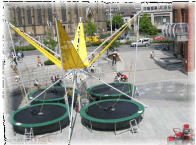
4 Sprungplätze sorgen für den ultimativen Kick

Aus der einzigartigen Kombination BUNGEE (Event- Klassiker) und TRAMPOLIN (Volkssport, Fitness und Gesundheit) entstand ein geniales Fun- Sport- Gerät. BUNGEE- TRAMPOLIN- SPRINGEN ist eine neue und erlebnisreiche Mit- Mach- Aktion für Veranstaltungen aller Art, die den Zeitgeist trifft. Eben eine echte Herausforderung für Jung und Junggebliebene (3 – 99 Jahre), bei der wirklich jeder mitmachen kann. Ein Freizeitspaß für die ganze Familie!