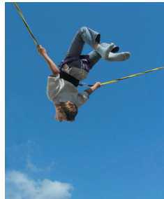
Nur Fliegen ist schöner!!!